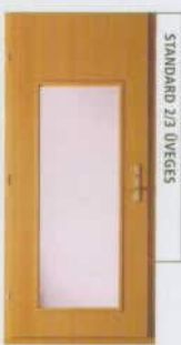
STANDARD 2/3 ÜVEGES