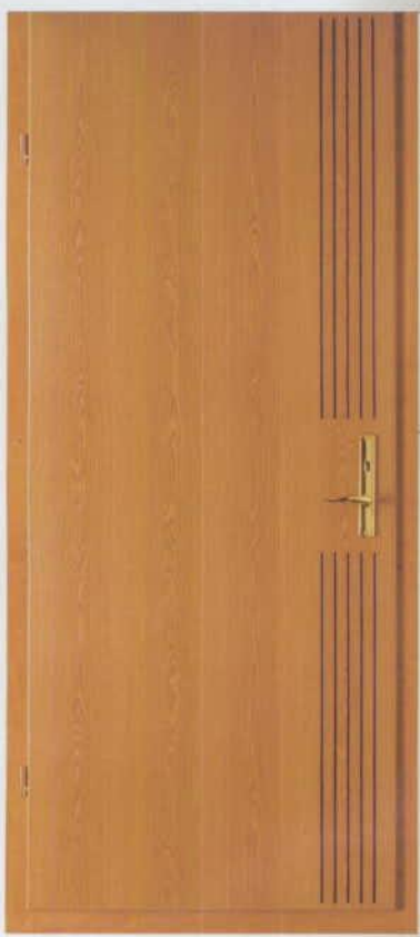
H MARI FELÜLETU AUTO