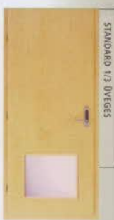
STANDARD 1/3 ÜVEGES