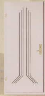
C MARI FELÜLETU AUTO