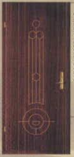
D MARI FELÜLETU AUTO