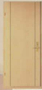
A MARI FELÜLETU AUTO