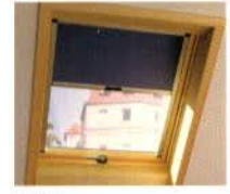
ZRV fényzáró belső roló