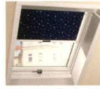
ZRS standard belső roló ZRE exclusiv belső roló