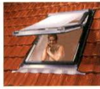
ZAR külső hővédő roló